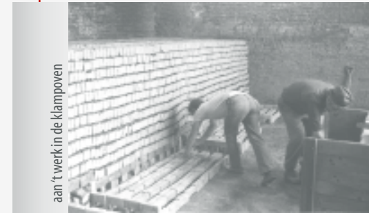
aan 't werk in de klampoven